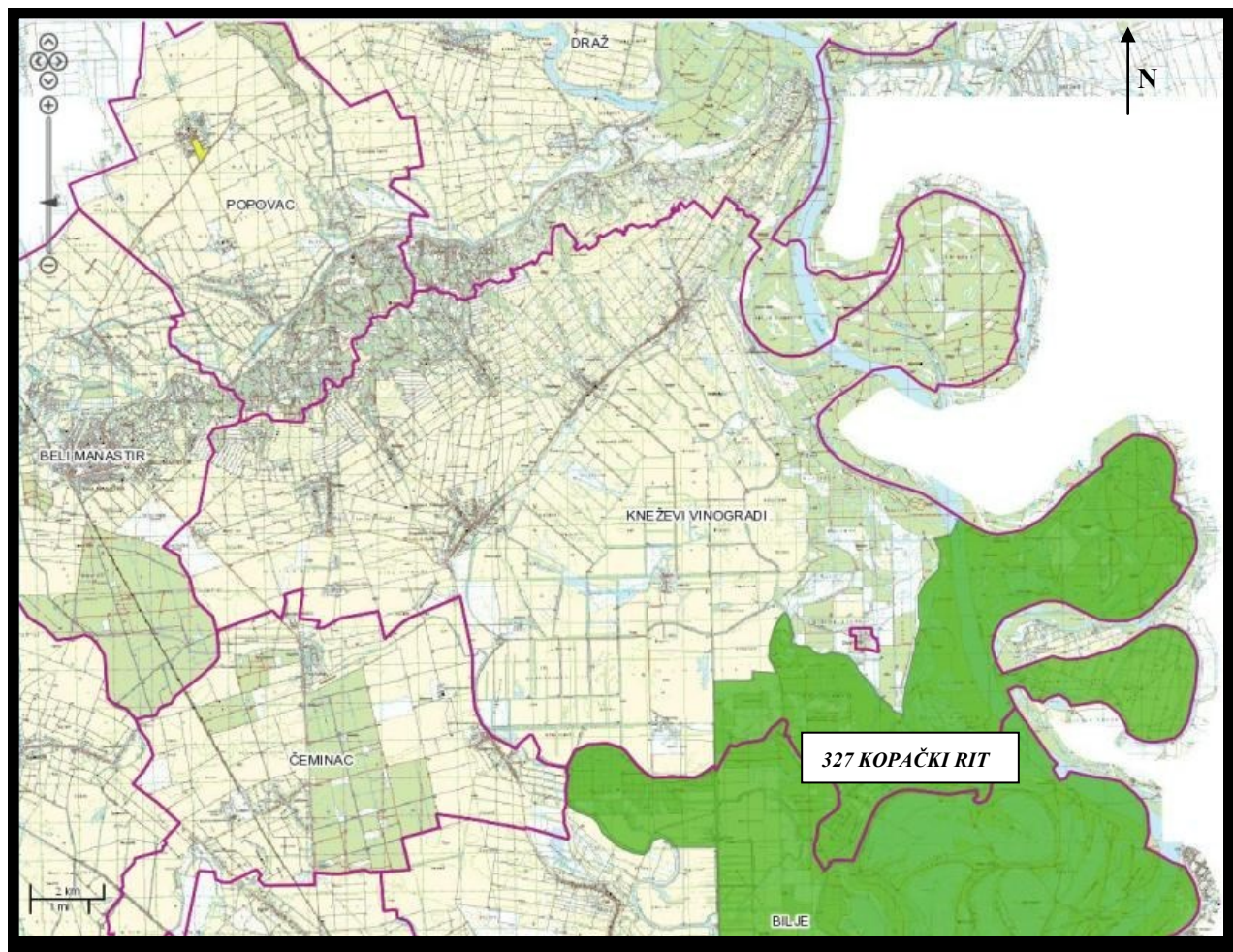
Slika 3. Prikaz zaštićenog područja Kopački rit (zeleno obojeno) na prostoru Općine Kneževi Vinogradi

Na prostoru Općine Kneževi Vinogradi nalazi se zaštićeno područje 327 KOPAČKI RIT – Park prirode (Slika 3.).