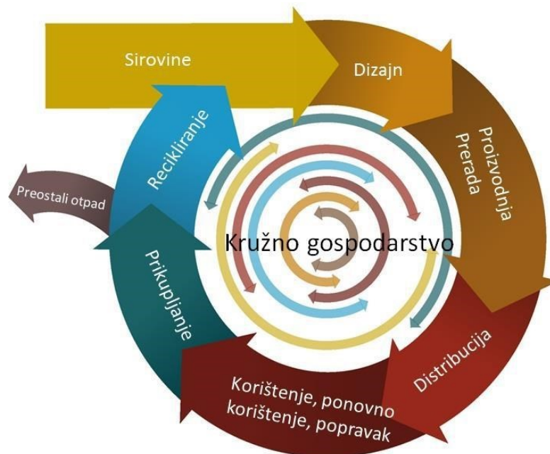
Slika 4. Model kružnog gospodarstva

Sprječavanje nastanka otpada hijerarhijski je najvažnija mjera za rješavanje problema otpada.