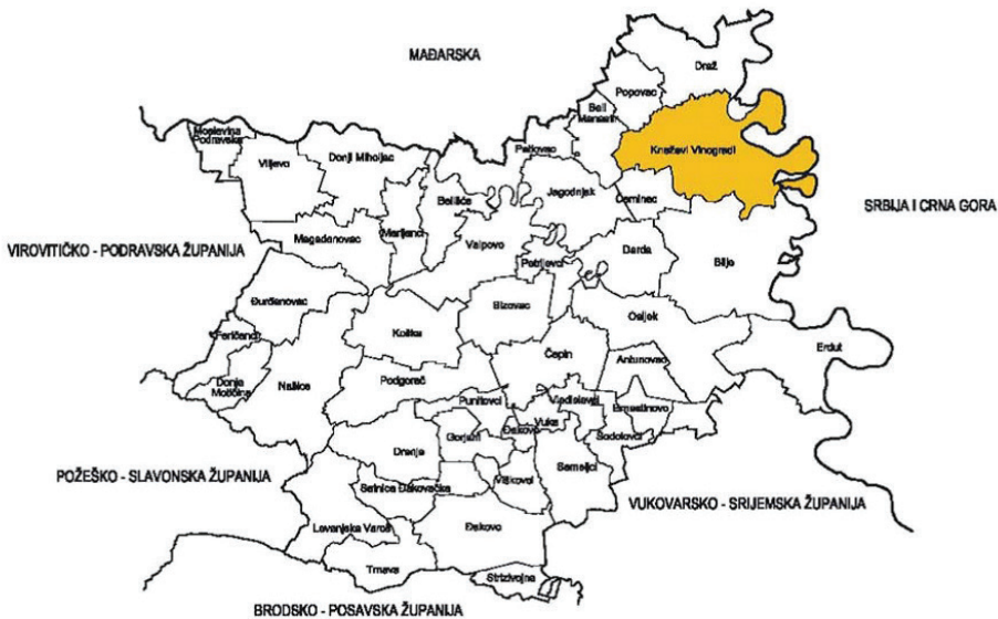
► SLIKA 1. POLOŽAJ OPĆINE KNEŽEVI VINOGRADI U OBŽ